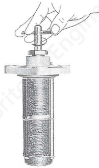
Impurities → Oil scums 不純物 → (油渣)